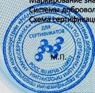
Схема сертификации: 1с.

Маркирование знаком соответствия производится на основании «Порядка применения знака соответствия Системы добровольной сертификации продукции наноиндустрии «НАНОСЕРТИФИКА».